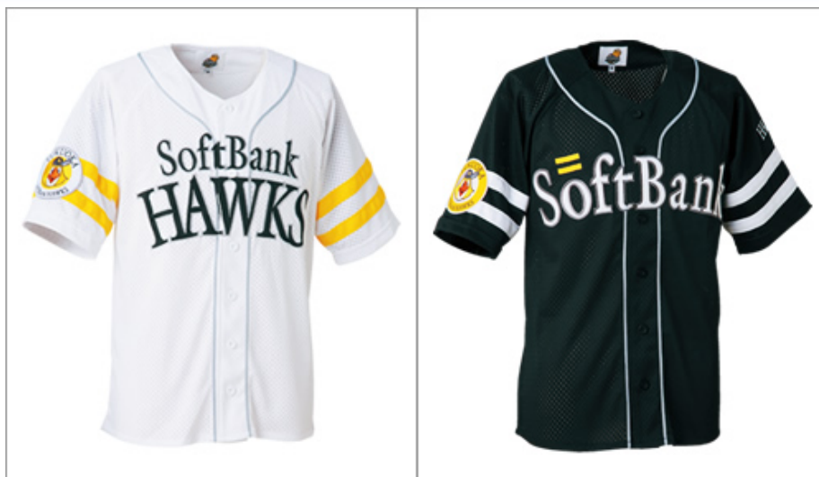
【特典の選べるレプリカユニフォーム】

ホテル日航福岡について ■客室数:360 ■本館:地上14階、地下3階 ■新館:地上3階、地下2階 株式会社 JAL ホテルズが世界に展開するホテルチェーン「ニッコー・ホテルズ・インターナショナル(NHI)」の国内8番目のホテルとして1989年7月8日に福岡市博多区に開業。ホテル日航福岡は、JR博多駅(博多シティ)から徒歩3分、利便性に優れたロケーションに位置する博多の国際級ホテルです。ハイクオリティを意識した客室空間はワンランク上の上質な滞在をお約束いたします。また全8種のレストラン&バーでは、博多ならではの旬の食材にこだわったお料理と心温まるサービスでおもてなしいたします。このほか2,000名を収容できる国際会議から大規模なイベントに対応可能な大宴会場「都久志の間」をはじめ、お客様の目的やシーンに合わせお選びいただける大小12の宴会場をご用意しております。ヨーロッパのゴシック聖堂をモチーフとした、石材はヨーロッパの大聖堂で使用されているもので形造られている新館3階の「チャペル プリエール」。チャペル後方には挙式用としては、西日本最大級のフランス・ケルン社製のパイプオルガンを配し、1999年に完成しました。挙式のみならずコンサートにも対応できる他にはない本格的なチャペルをご用意しております。 http://www.hotelnikko-fukuoka.com/